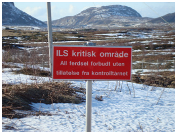
Skilt for restriksjonsområde for navigasjonsanlegg

Flynavigasjonstjenesten har flere instrumenter og instrumenthytter som er plassert rundt på lufthavnområdet. Disse anleggenes funksjon kan påvirkes av ferdsel og kjøring i nærområdene. Disse områdene vil normalt være skiltet slik: