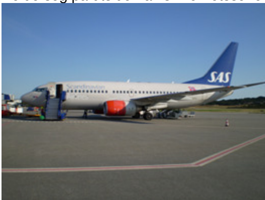
Merking med rød sikkerhetslinje

Sikkerhetssonen rundt et parkert luftfartøy kan være delvis (oppstillingsplass for fly) merket med en rødmalt stripe (sikkerhetslinje) på bakken. Sikkerhetslinjen tjener også som en sikkerhetsstopp for alt bakkeutstyr før siste innkjøring til luftfartøyet, samt som en sikkerhetssone for luftinntak og propellere. I tillegg vil det normalt også være utplassert godt synlige kjegler rundt luftfartøyets ytterpunkter. Hvis sikkerhetssonen ikke er merket er hovedregelen at man ikke skal nærme seg mer enn 4 m fra et parkert luftfartøy hvis man ikke har noe tjenestelig gjøremål ved luftfartøyet. Bare kjøretøy og utstyr som er direkte koplet til handling, og line-mekanikere kan parkere i dette området. Andre kjøretøy skal holde seg på utsiden av sikkerhetssonen.