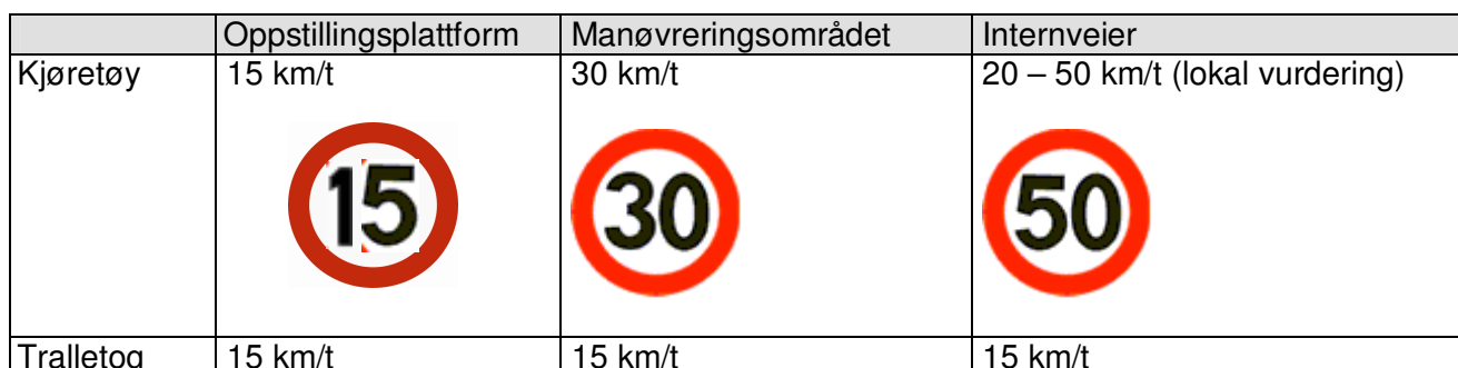
Tabell 1: Fartsgrensener på flyside

Fartsgrensene 1) på flyside er som følger: