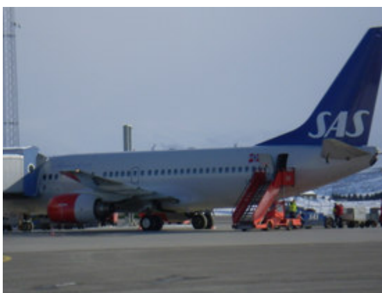
Bruk av bakre dør ved bro

Flyoperatøren er ansvarlig for å lede passasjerer sikkerhetsmessig forsvarlig til og fra luftfartøy. Til dette benyttes både øremerket personell og materiell (kjegler og sperrebånd) Personalet må være spesielt oppmerksom på farer for passasjerer som går til og fra luftfartøy på gater der det på nabogaten starter fly med lave motorer (B737 eller liknende).