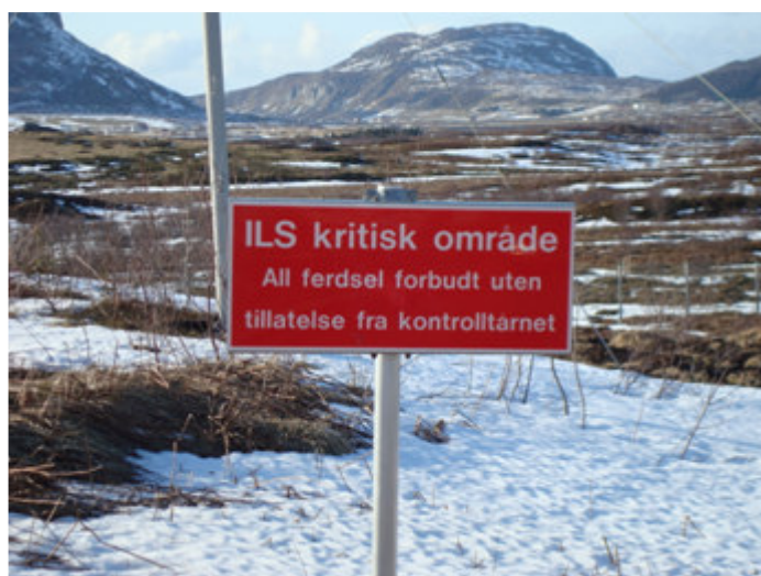
Skilt for restriksjonsområde for navigasjonsanlegg

Flynavigasjonstjenesten har flere instrumenter og instrumenthytter som er plassert rundt på lufthavnområdet. Disse anleggenes funksjon kan påvirkes av ferdsel og kjøring i nærområdene. Disse områdene vil normalt være skiltet slik: