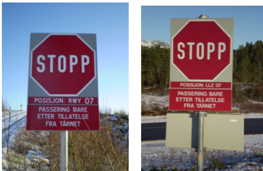
Venteposisjonsskilt for kjøretøy

Der hvor vei tilslutter rullebane, skal det settes opp venteposisjonsskilt for kjøretøy, jf. BSL E 3-2 § 14-3 (4).