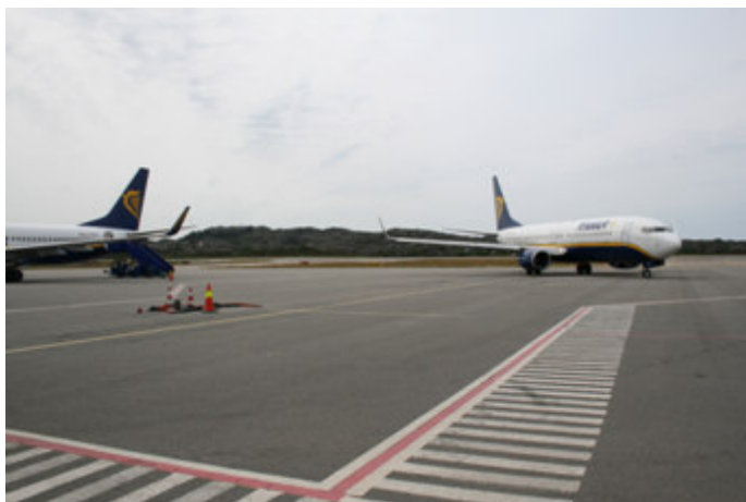
Merking med rød sikkerhetslinje