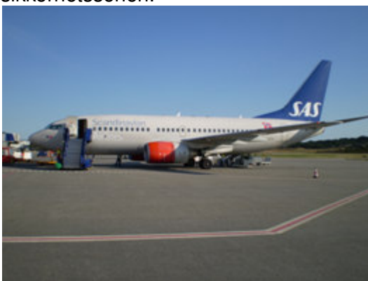
Merking med rød sikkerhetslinje

Sikkerhetssonen markeres av og til med kjegler rundt luftfartøyets ytterpunkter. Hvis sikkerhetssonen ikke er merket er hovedregelen at man ikke skal nærme seg mer enn 4 m fra et parkert luftfartøy hvis man ikke har noe tjenestelig gjøremål ved luftfartøyet. Bare kjøretøy og utstyr som er direkte koplet til handling, og line-mekanikere kan parkere i dette området. Andre kjøretøy skal holde seg på utsiden av sikkerhetssonen.