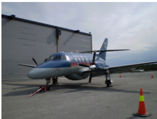
Bruk av kjegler ved parkering av luffartøy

Ved ankomst skal luffartøyets antikollisjonslys fortsatt være påslått inntil luffartøyet står parkert på oppstillingsplass og motoren er stanset. Luffartøys hovedmotorer skal stanses hurtigst mulig. Når antikollisjonslysene er slukket, skal luffartøyets ytterpunkter markeres med godt synlige kjegler når luffartøy er parkert på oppstillingsplasser i områder hvor det også pågår annen trafikk, herunder kjøring med bakkeutstyr eller gående passasjerer.