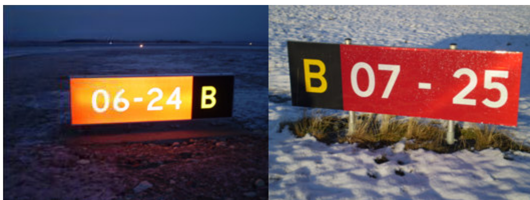
Venteposisjonsskilt for rullebane (opplyst og reflekterende)

Ved en venteposisjon for rullebane (der taksebanen tilslutter rullebanen) er det alltid satt opp venteposisjonsskilt for rullebane på begge sider av taksebanen. Disse ser normalt slik ut (bokstavene som benevner taksebanene og tallene som beskriver rullebanenes magnetiske kompassretning vil variere fra lufthavn til lufthavn):