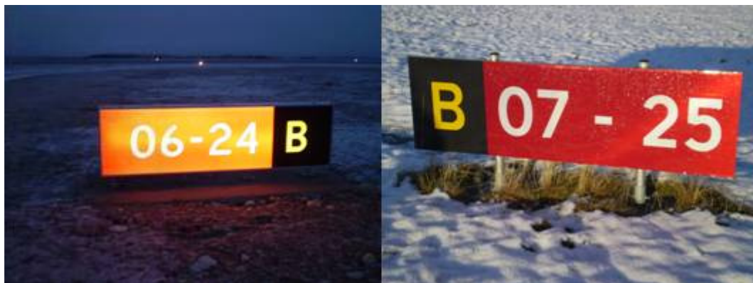
Venteposisjonsskilt for rullebane (opplyst og reflekterende)

Ved en venteposisjon for rullebane (der taksebanen tilslutter rullebanen) er det alltid satt opp venteposisjonsskilt for rullebane på begge sider av taksebanen. Disse ser normalt slik ut (bokstavene som benevner taksebanene og tallene som beskriver rullebanenes magnetiske kompassretning vil variere fra lufthavn til lufthavn):