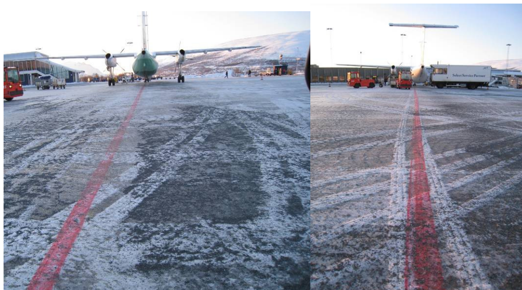
Merking av snø- og isdekt ledelinje på oppstillingsplattform

En snødekt taksebanesenterlinje eller ledelinje på oppstillingsplattform skal merkes med nye røde linjer på snøen dersom det er nødvendig for sikker manøvrering av luftfartøyer.