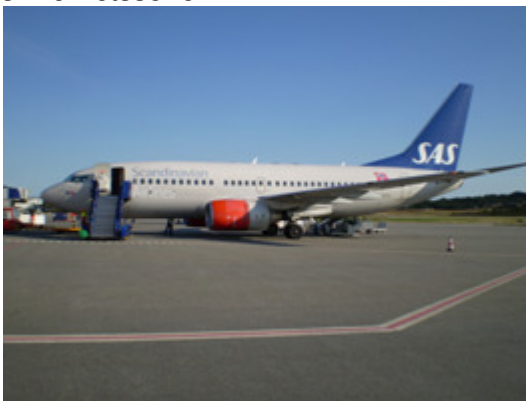
Merking med rød sikkerhetslinje

Sikkerhetssonen rundt et parkert luftfartøy kan være helt eller delvis merket med en rødmalt stripe (sikkerhetslinje) på bakken. Sikkerhetslinjen tjener også som en sikkerhetsstopp for alt bakkeutstyr før siste innkjøring til luftfartøyet, samt som en sikkerhetssone for luftinntak og propellere. I tillegg vil det normalt også være utplassert godt synlige kjepler rundt luftfartøyet. Hvis sikkerhetssonen ikke er merket er hovedregelen at man ikke skal nærme seg mer enn 4 m fra et parkert luftfartøy hvis man ikke har noe tjenestelig gjøremål ved luftfartøyet. Bare kjøretøy og utstyr som er direkte koplet til handling, og line-mekanikere kan parkere i dette området. Andre kjøretøy skal holde seg på utsiden av sikkerhetssonen.