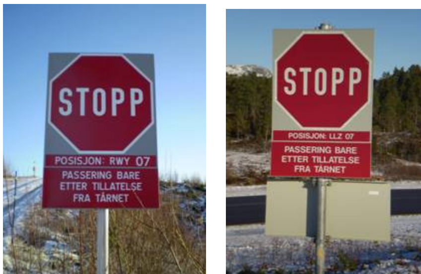
Venteposisjonsskilt for kjøretøy

Der hvor vei tilslutter rullebane, skal det settes opp venteposisjonsskilt for kjøretøy, jf. BSL E 3-2 § 14-3 (4) .