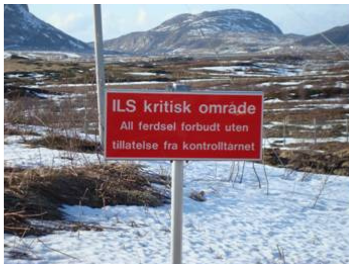
Skilt for restriksjonsområde for navigasjonsanlegg

Flynavigasjonstjenesten har flere instrumenter og instrumenthytter som er plassert rundt på lufthavnområdet. Disse anleggenes funksjon kan påvirkes av ferdsel og kjøring i nærområdene. Disse områdene vil normalt være skiltet slik: