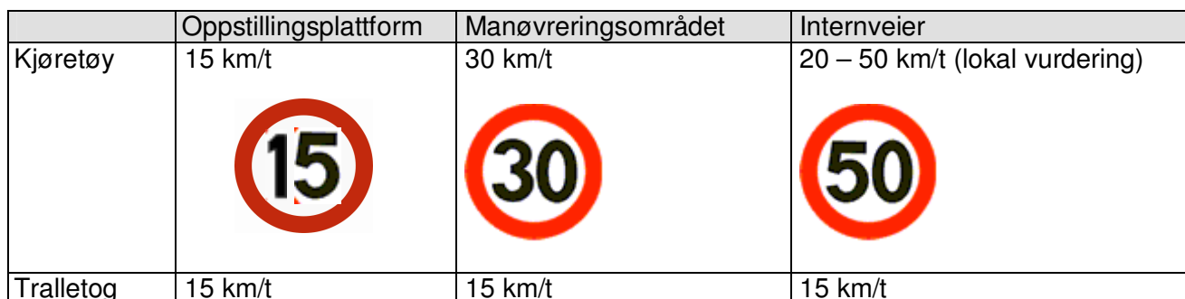
Tabell 1: Fartsgrenser på flyside

Fartsgrensene 1) på flyside er som følger: