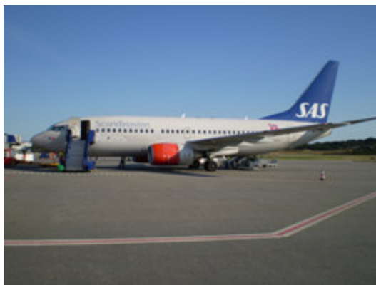
Merking med rød sikkerhetslinje

All kjøring nærmere luftfartøyet enn 4 m må foregå med største varsomhet. Under kjøring ved og til luftfartøy skal hastigheten nedsettes til et minimum, og største forsiktighet skal utvises slik at skader unngås. Man skal kjøre inn mot luftfartøyet i gangfart. Det er forbudt å parkere kjøretøy og utstyr eller arbeide bak kjøretøy som bare kan rygge ut fra sin aktuelle posisjon.