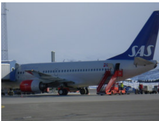
Bruk av bakre dør ved bro

Flyoperatøren er normalt ansvarlig for å lede passasjerer sikkerhetsmessig forsvarlig til og fra luftfartøy. Til dette benyttes både øremerket personell og materiell (kjegler og sperrebånd). Personalet må være spesielt oppmerksom på farer for passasjerer som går til og fra luftfartøy på gater der det på nabogaten starter fly med lave motorer.